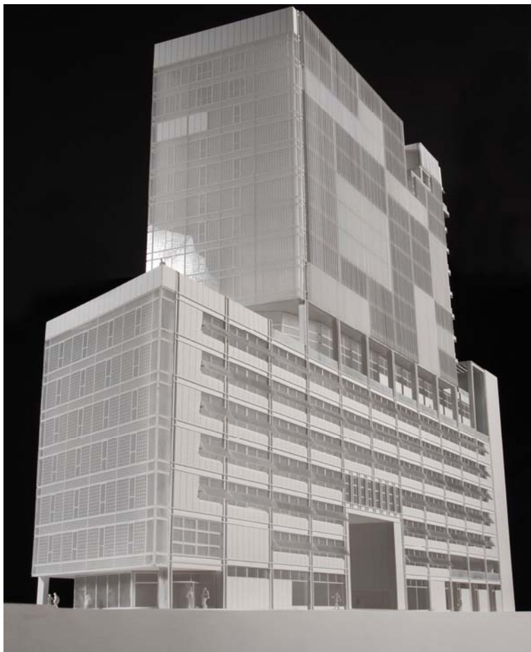
Figura encabezado artículo